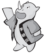
갭켄사이 캐릭터 사이판

교육연구활동 중이란... 수업을 받는 동안, 학교행사에 참가하는 동안 등을 말합니다. 자세한 내용은 아래를 참조하세요!