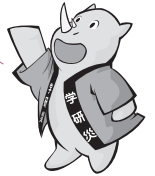
Sai-chan, nhân vật đại diện của Bảo hiểm tai nạn cho sinh viên Gakkensai

Khi đang tham gia các hoạt động giáo dục, nghiên cứu có nghĩa là như thế nào... Là khi đang tham gia lớp học, và các hoạt động tại trường, v.v... Các bạn hãy tham khảo phần bên dưới để biết thêm thông tin chi tiết!